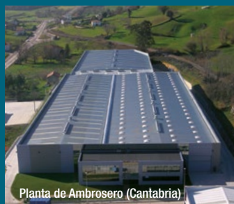
Planta de Ambrosero (Cantabria)