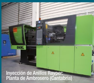
Inyección de Anillos Rayper: Planta de Ambrosero (Cantabria)