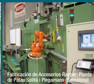
Fabricación de Accesorios Rayper: Planta de Palau Solità i Plegamans (Barcelona)