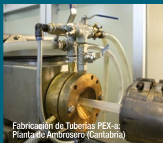
Fabricación de Tuberías PEX-a: Planta de Ambrosero (Cantabria)